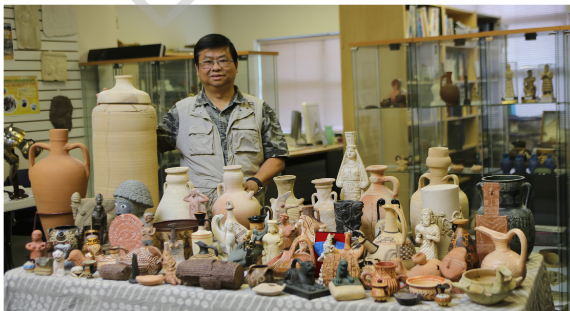
作者和他所收藏其中一部份的考古文物